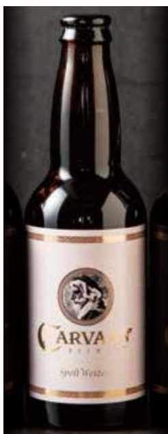
スペルト・ ヴァイツェン Spelt Weizen 770

Japan Great Beer Awards 2020, 2021, 2022 Bronze