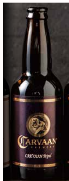
カールヴァーン・ トリペル CARVAAN Tripel 1,265

International Beer Cup 2019 Bronze, 2020 Silver