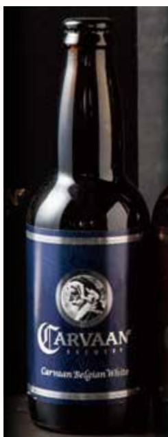
カールヴァーン・ ベルジャンホワイト CARVAAN Belgian White 770

International Beer Cup 2018, 2019 Bronze 2021 Silver