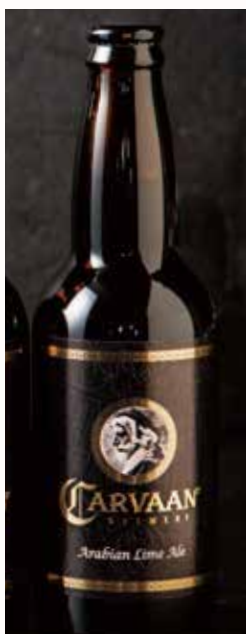
アラビアン ライム・エール Arabian Lime Ale 770

CARVAANのビールがご家庭でもお楽しみ頂けます。スタッフにお申し付け下さい。