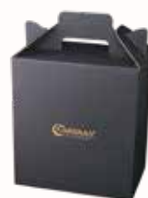
ギフトボックス 6本用 330

CARVAANのビールは酵母が生きています。 お持ち帰りになりましたら、冷蔵庫内で瓶を立てて保管してください。