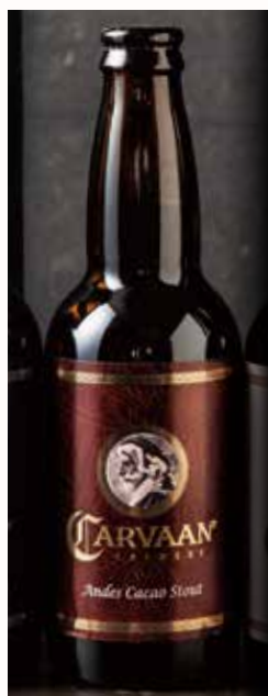
アンデスカカオ・ スタウト Andes Cacao Stout 770

Japan Great Beer Awards 2020 Bronze 2021, 2022 Silver