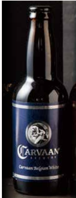
カールヴァーン・ ベルジャンホワイト CARVAAN Belgian White 770

International Beer Cup 2018, 2019 Bronze 2021 Silver