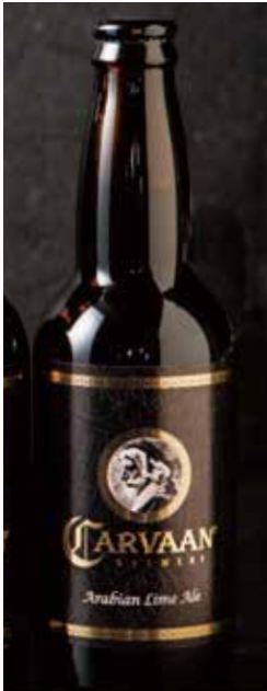
アラビアン ライム・エール Arabian Lime Ale 770

CARVAANのビールがご家庭でもお楽しみ頂けます。スタッフにお申し付け下さい。