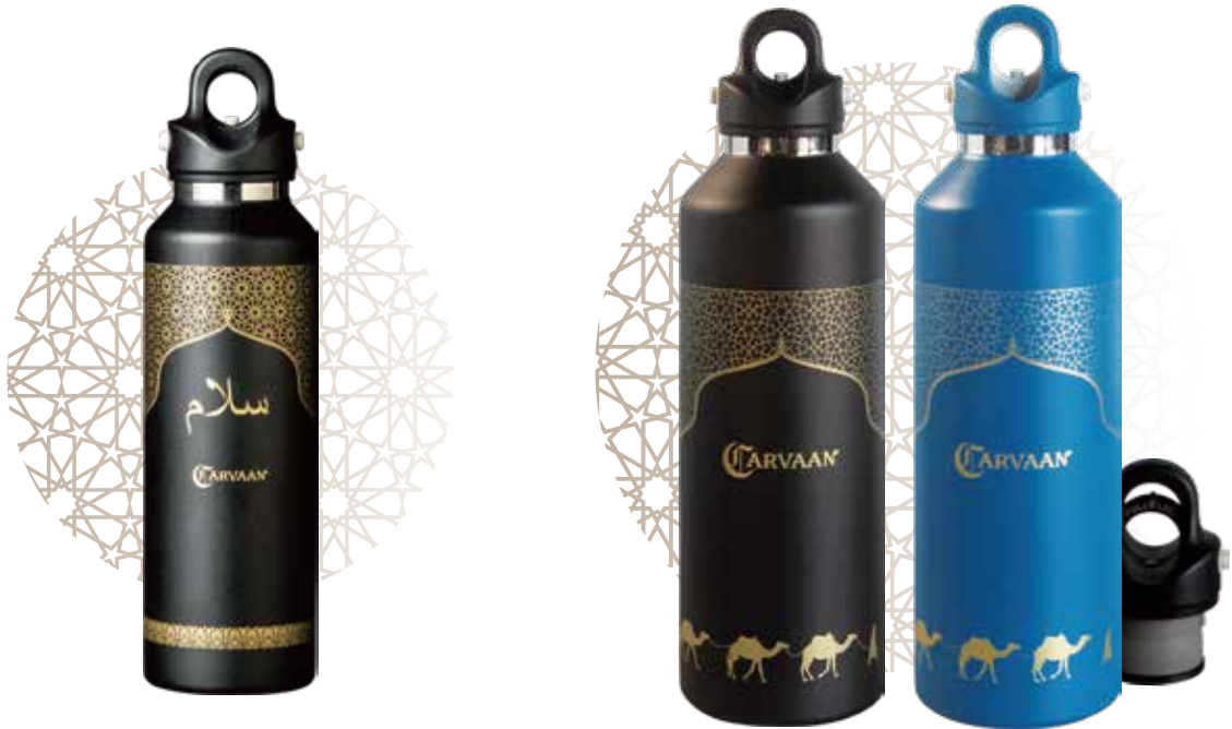
グラウラー【592ml】 Growler RevoMax2 20oz ブラック