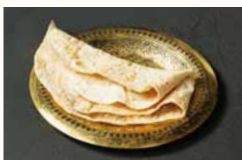
アラビアン・ブレッド