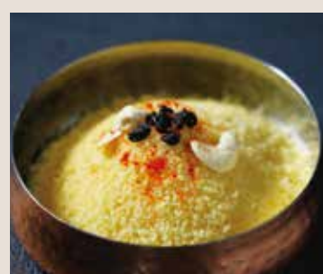
クスクス 770 小麦、カシューナッツ