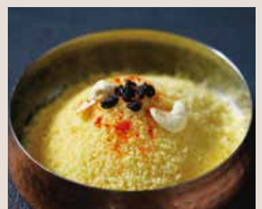
クスクス 小麦、カシューナッツ