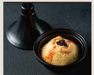
クスクス 小麦、カシューナッツ