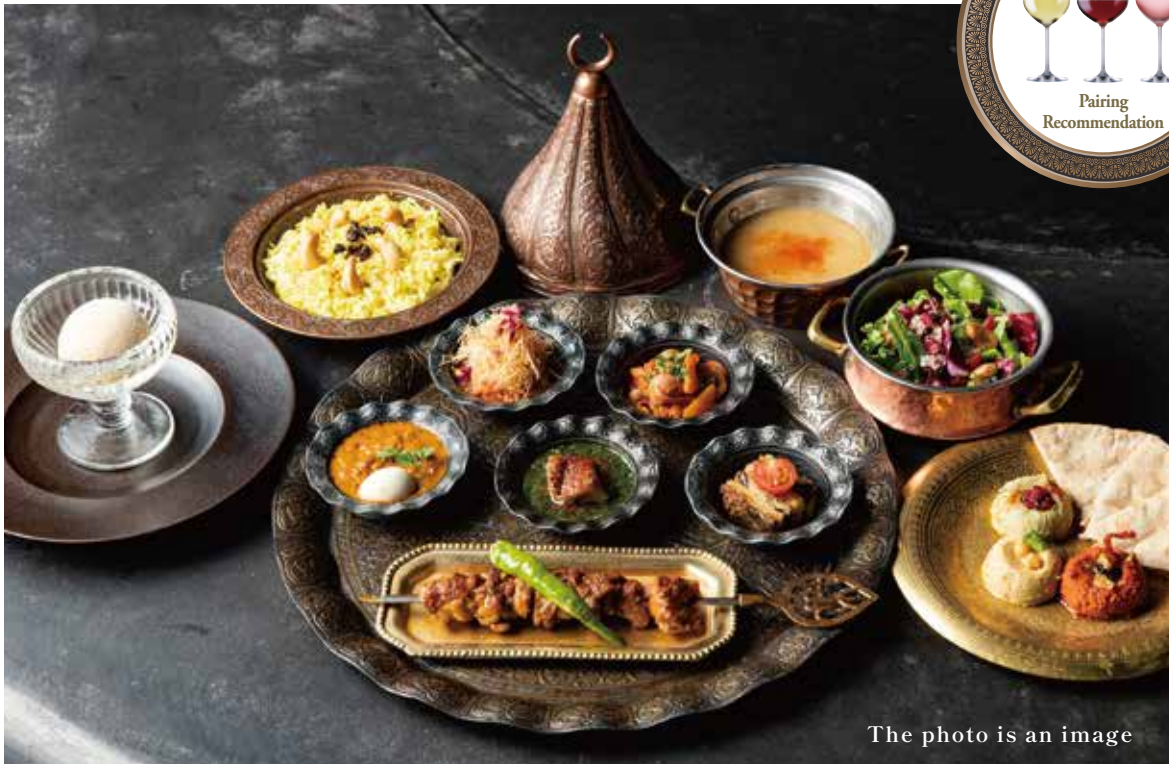
The photo is an image