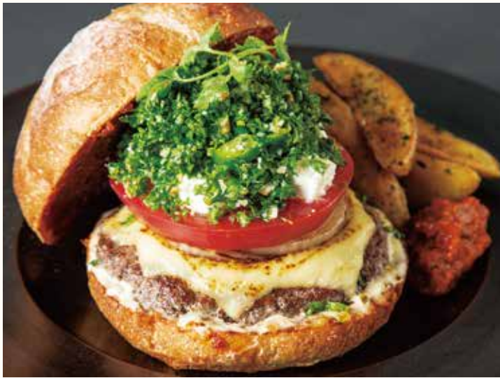
The photo is an image

• Each dish comes with Coffee or Hibiscus tea.