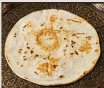
Ancient wheat bread Aish