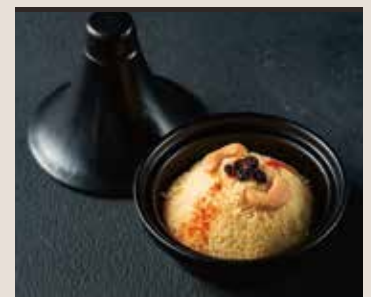
Couscous Wheat, Cashewnut