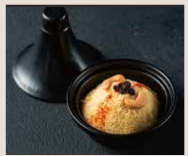
Couscous Wheat, Cashewnut