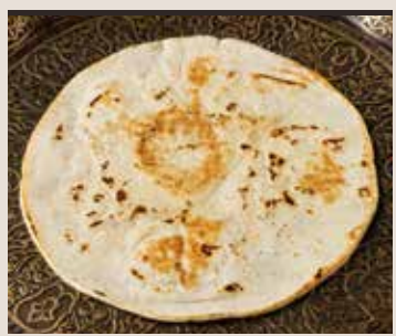
Ancient wheat bread Aish