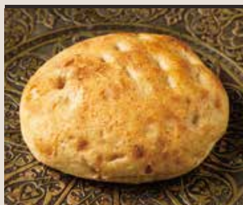
Ancient wheat bread Khbuz