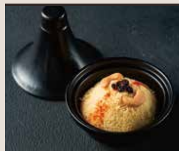
クスクス 小麦、カシューナッツ