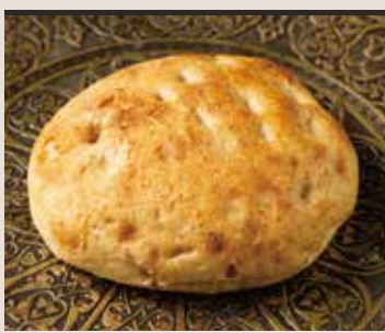
Ancient wheat bread Khbuz