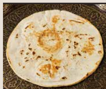
古代小麦のアラビア・パン エイシ