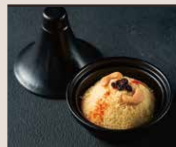
Couscous Wheat, Cashewnut